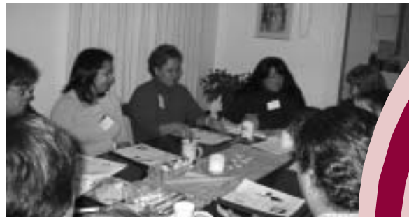
Toppenish Justice Circle participants identifying issues of concern for low-income women.

T oppenish—The Toppenish Justice Circle has created a new group called Mujeres Fuertes