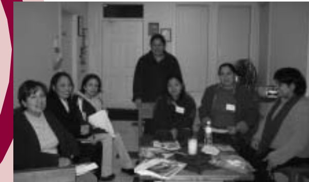
The Renton Women’s Justice Circle participants realized their goal of obtaining health care for their children. Pictured above is their meeting with Renton Community Health Center staff to sign up for the state-wide children’s health program. The group is also working to hold ESL classes at the community room at Renton Family Housing. Through this collaboration, they were able to overcome difficult work schedules and availability of child care.

“Cuando estábamos planeando nuestra junta para visitar el centro comunitario, no pensaba que podríamos cambiar algo,” dice. “Después de la visita, me di