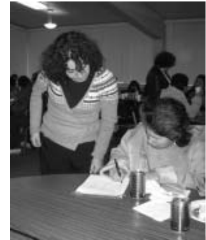
Seattle Cristo Rey Women’s Justice Circle collecting signatures for the DREAM Act.

The women, who call themselves the Mujeres de Fe (“Women of Faith”) Circle, are working to help pass the “Development, Relief, and Education for Alien Minors Act” also known as the “DREAM Act.” Mujeres de Fe are gathering signatures and encouraging U.S. Senators Patty Murray and Maria Cantwell to sign on as co-sponsors of the legislation. The women collected signatures after Mass one Sunday and are scheduling a visit to Cantwell’s office and a forum with Murray to