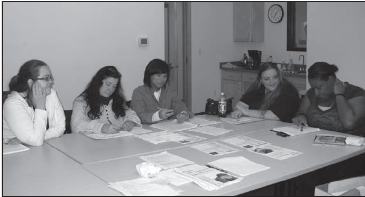
Participants plan healthy meals brochure