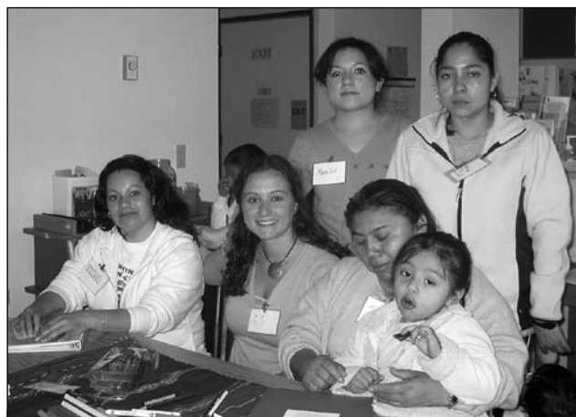
Kent Justice Circle participants focused on building a safe community.

jes de Kent, dice que el evento sirvió para cuestionar ciertas preocupaciones entre los vecinos y grupos locales de servicio a la comunidad.