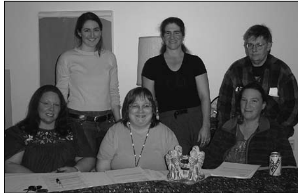
Women from the Spokane Justice Circle established www.spokanenearhome.org to educate and advocate for creating affordable housing in Spokane.

Con el apoyo entusiasta del consejo parroquial, las mujeres también están planeando formar un grupo de apoyo para víctimas de violencia doméstica en la parroquia de Santa María. Actualmente están reuniéndose con representantes