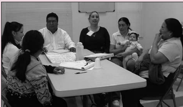
Mattawa Women’s Justice Circle meeting to establish the Mattawa Food Bank ad hoc committee.

S EATTLE—For women in the St. Mary Parish Justice Circle, domestic violence, unfortunately, hits close to home. After one Latina member shared her story of surviving—and eventually leaving—an abusive relationship, other women told of