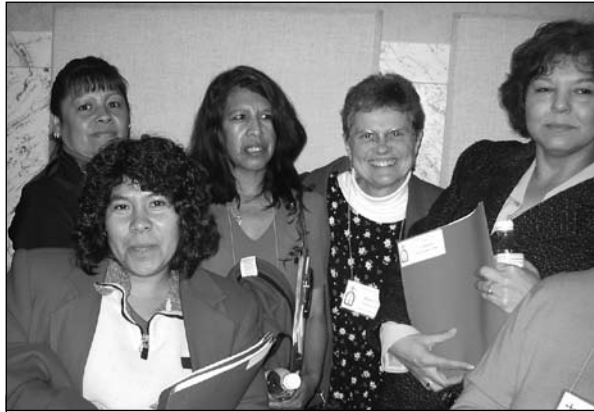
Women from the Wapato Women Justice Circle attended Advocacy Day in Olympia.

Murray y entregaron peticiones con firmas, pidiendo una vía clara hacia la ciudadanía