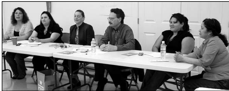
Pasco Circle members meet with panel of community leaders.

P asco—One in three adult women worldwide experience abuse by someone they know 1 . That figure is more than a statistic for the members of the Pasco Women’s Justice Circle at Tepeyac Haven, a housing complex for farm workers. The