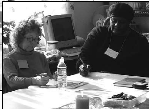
Burien women reflect on housing goals as motivation for action.