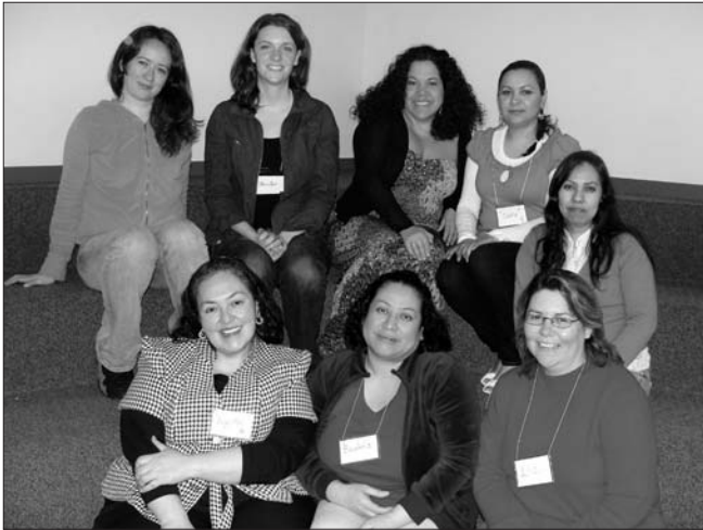
Bothell Circle participants are organizing the first bullying prevention community forum in Spanish!