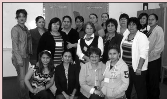
Sunnyside Women Leaders' Justice Circle participants prove that ¡Sí se Puede!

una licencia de conducir sin un número de Seguro Social. Las participantes del Círculo contribuyeron a la derrota del proyecto de ley SB 6436, que habría negado el acceso a las licencias de conducir a personas que no puedan presentar pruebas de ciudadanía de EE.UU. o estatus como residente permanente legal. Estas mujeres poderosas están listas para seguir organizándose para asegurar que los miembros de su comunidad sean capaces de conducir al trabajo y la escuela y cumplir con sus obligaciones familiares y comunitarias.