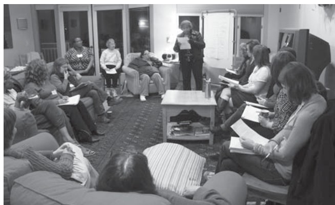
Housing advocates engage in dialogue with Jubilee Women's Center residents.

"The myriad of applications to different housing offices is exhausting... Something should be done about the major concern of the homeless person's capability to wade through all the red tape and confusion."