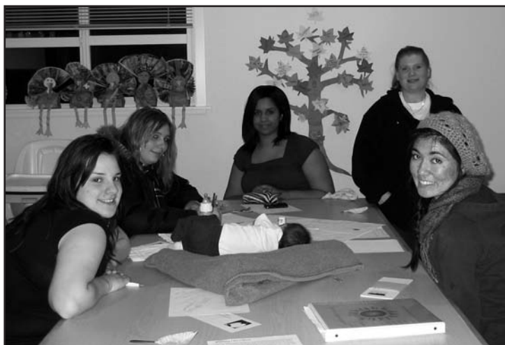
Harrington House Women’s Justice Circle participants.

S outh Park—A group of women from Campaña Quetzal, leaders in the Latino community, who have been working to increase parent engagement in the schools never imagined what powerful