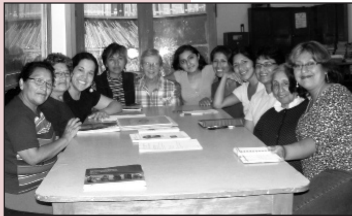
Training at Centro Maria Rosa—Lima, Peru

"We are so excited about implementing this amazing and thoughtful program. I love how...the sessions were designed especially to help low income women realize their power and knowledge!"