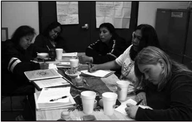
Chief Seattle Club members advocating for justice.